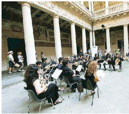
A fianco, concerto nel cortile antico di Palazzo Bo; a sinistra, la visita guidata all'ala moderna del Bo nel segno di Gio Ponti