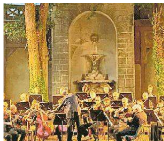
L'Opv a palazzo Zuckermann

zioni, compagnie teatrali e ensemble musicali del territorio. Per quanto riguarda il cinema, fino alla fine di giugno la scalinata del Portello ospiterà la dodicesima edizione del River Film Festival, con il concorso internazionale di cortometraggi, mentre i film della stagione cinematografica appena con-