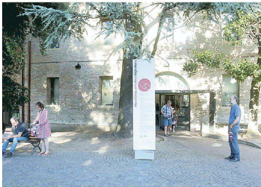
L'ingresso del Museo degli Eremitani a Padova che ospiterà la mostra di Ligabue

La mostra agli Eremitani dal 22 settembre nell'ambito delle iniziative dell'Estate Carrarese